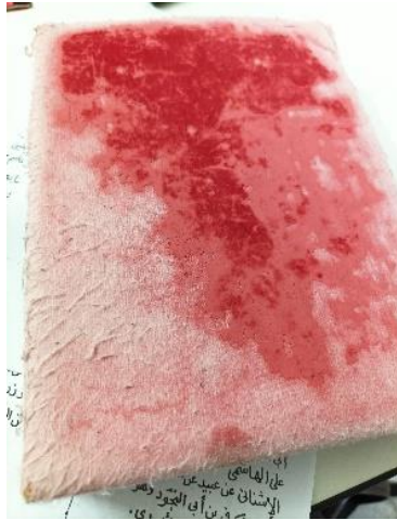
Gambar 1: Buku daftar pelajar Dato' Haji Sallehudin Omar (1)

2022). Kebaikan perkara ini adalah supaya setiap pelajar dapat dipastikan lengkap membaca 30 juzu' dari awal hingga akhir al-Quran tanpa tertinggal satu ayat pun. Setiap guru al-Quran wajar mencontohi amalan ini supaya dapat menambah kepercayaan masyarakat terhadap pengajian talaqqī al-Quran bersanad.